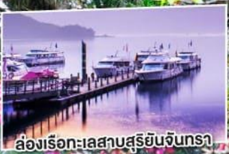
ส่องเรือทะเลสาบสุริยันจันทรา