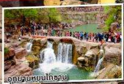
อุทยานหยุนโกซาน