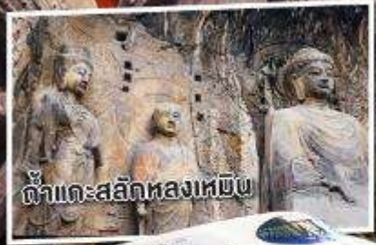
ถ้ำแกะสลักหลงเหมิน